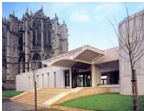
Galerie nationale de la tapisserie