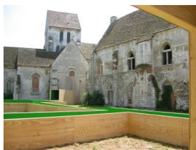
Krijn de Koning, HERE NOW, Maladrerie St-Lazare, 2010