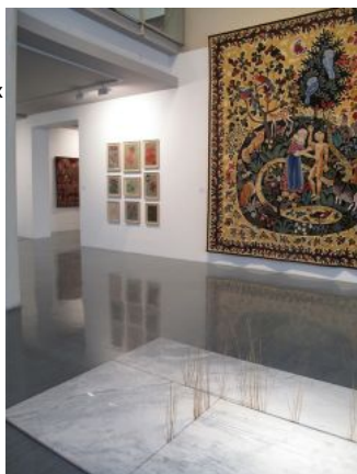
Exposition Plein champ, Galerie nationale de la tapisserie, 2013