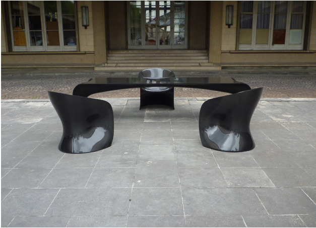
Christian Ghion Bureau et fauteuils