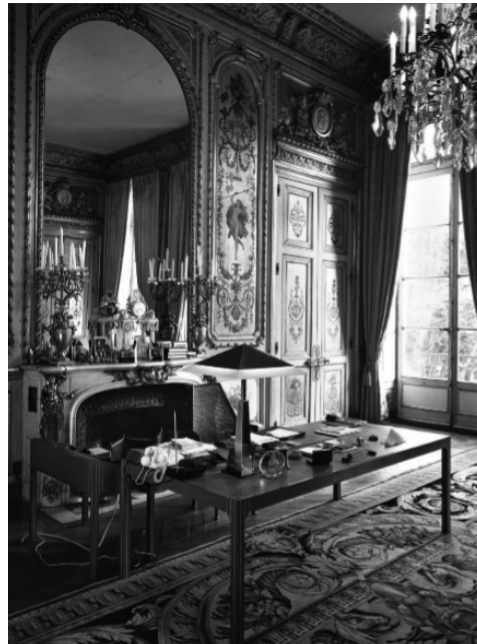
Pierre Paulin Aménagement pour le bureau de François Mitterrand.

« Le design du pouvoir n'est pas qu'une question de forme esthétique ou de fonction, c'est aussi une manière d'être vue par le citoyen. »