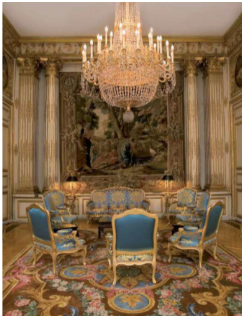
Salon Marie Antoinette Palais de l'Élysées

« Le design du pouvoir est une manière de créer une interférence positive et harmonieuse avec un décor. Chaque objet d'une décoration intérieure doit pouvoir être en interrelation avec d'autres objets. »