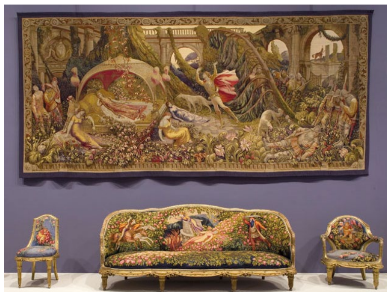
Jean Veber, tapisserie et ensemble de mobilier (chaise, canapé et fauteuil), début du XX e siècle