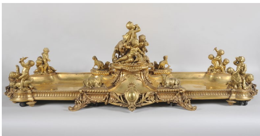
Maison Christofle et compagnie