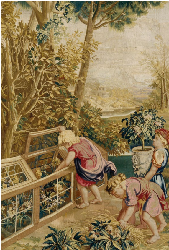
Manufacture des Gobelins Laine, soie et fil d'or

Tenture des Enfants jardiniers, XVII e siècle