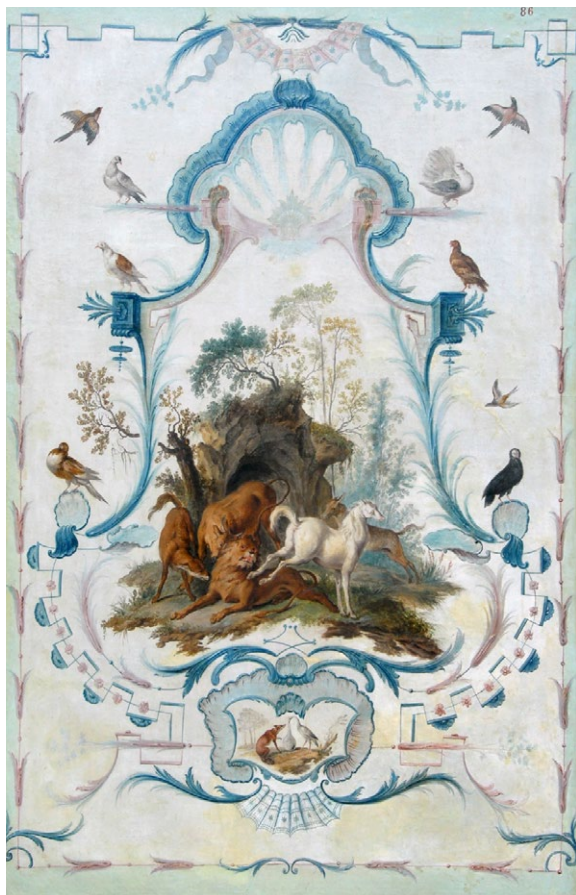
Huile sur toile