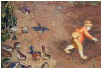
Détails de tapisseries présentées dans l'exposition

En partenariat avec la marque LEGO, des ateliers gratuits « LEGO, construit le futur » sont proposés aux enfants de 6 à 12 ans, avec pour thème « imagine le mobilier de demain ». Sur inscription : mobiliernational.culture.gouv.fr Les constructions individuelles des enfants seront mises en commun pour permettre de voir émerger au fur et à mesure une œuvre participative. Des ateliers LEGO® DUPLO® pour les tout-petits dès 18 mois sont également proposés, ainsi que de nombreuses autres surprises.