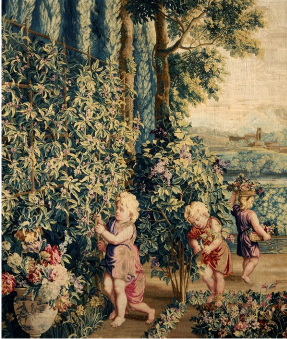
Manufacture des Gobelins Laine, soie et fil d'or