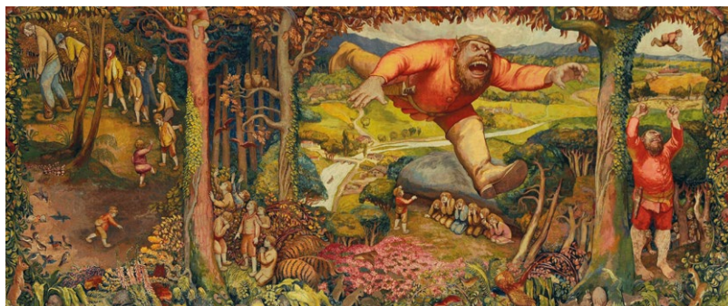
Jean Veber, Le Petit Poucet , tapisserie, Manufacture des Gobelins, 1920

Direction de la communication et du mécénat Céline Méfret celine.mefret@culture.gouv.fr T. 01 44 08 53 20