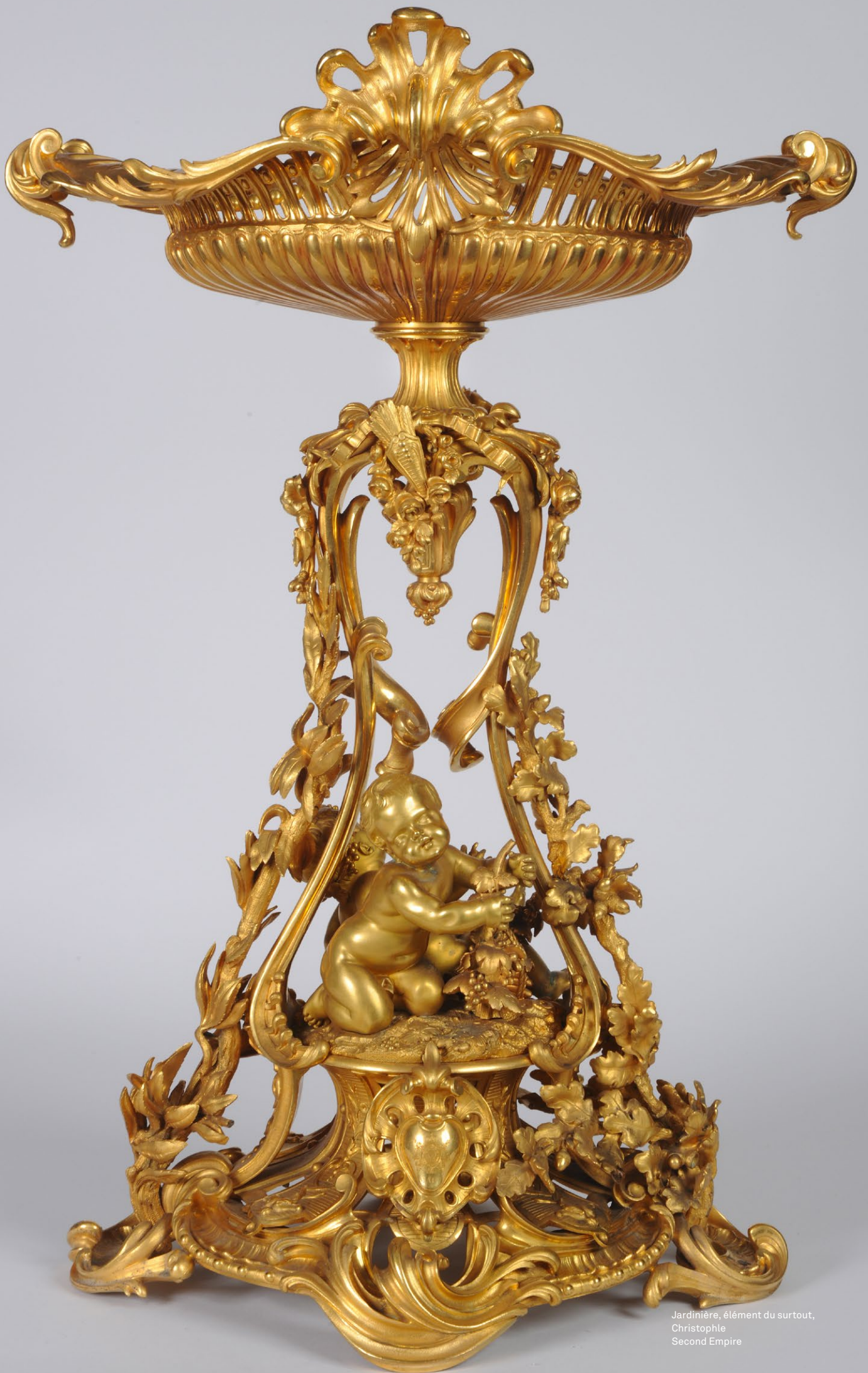
Jardinière, élément du surtout, Christophe Second Empire