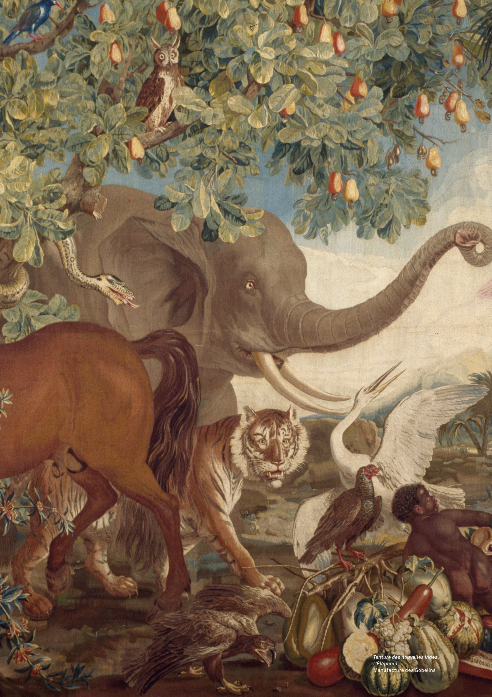
Tenture des nouvelles Indes, L'Éléphant Manufacture des Gobelins