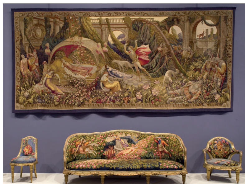
Jean Veber, tapisserie et ensemble de mobilier (chaise, canapé et siège), début du XX e siècle