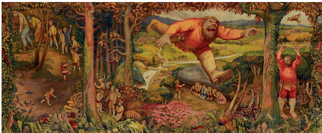
Jean Veber, Le Petit Poucet , tapisserie, Manufacture des Gobelins, 1920 - Photo © Mobilier national, Isabelle Bideau