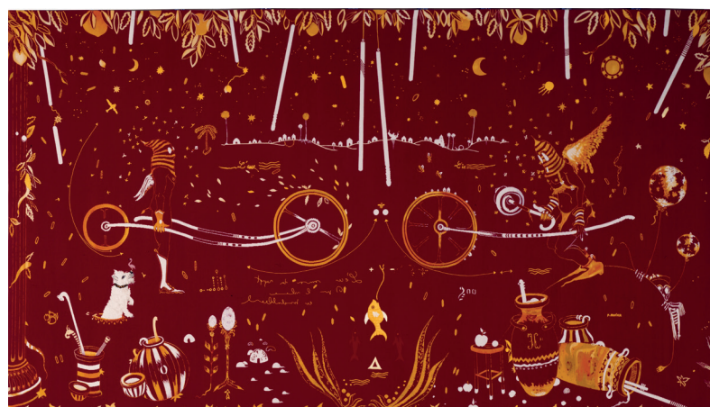
Phillipe Favier, Les Mille et une nuisent , Manufacture de Beauvais et atelier d'Alençon, 1996

Un livret-jeu sera offert aux jeunes visiteurs.