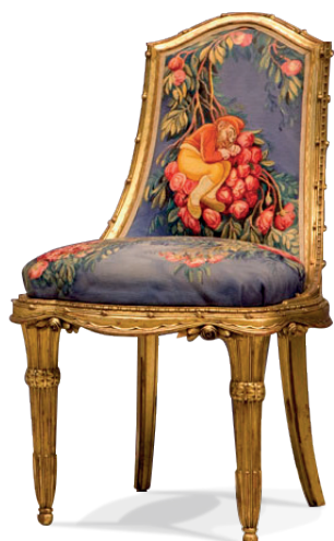
Jean Veber, les lutins , une chaise, tapisserie d'ameublement de Beauvais, début XX e siècle